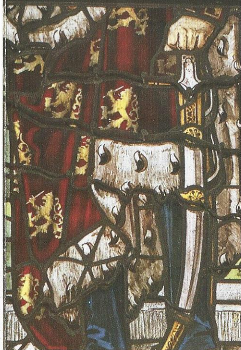
ontwerp: beaules scholma