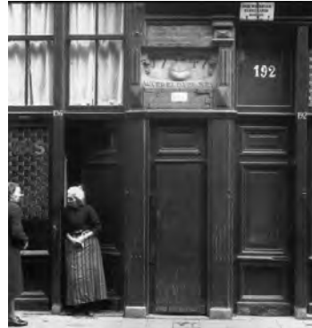
Onbewoonbaar verklaarde woning

Op die afgekeurde woning In 't hartje van de Jordaan Daar versleet ik m'n jeugd Had ik leed, had ik vreugd In de strijd om een eerlijk bestaan Maar toch voel ik mij een koning Ook al vloeit er dikwijls een traan Op die afgekeurde woning In 't hart van die ouwe Jordaan